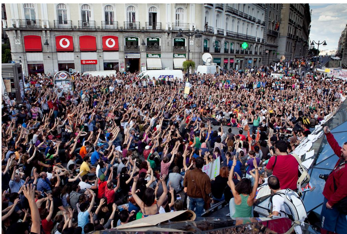
Ilustración 5: Aplaudiendo, Puerta del Sol, Madrid, 20.5.2011

en la actuación policial. Y ahí tenemos que tener mucho cuidado y no tenemos que dejar que sigan la típica senda de criminalizarte. Tenemos que seguir como estamos. Ayer hemos visto la situación ridícula de que un periódico que se llama ABC, un periódico de este país, sacó una foto en la portada donde hablaba de las movilizaciones en nuestro país, pero claro, como había una plaza llena de 50.000 personas pacíficamente sacó una foto de Italia de un coche ardiendo y un señor tirando un extintor. Bueno, pues lo que queremos hacer es que el año que viene tengan que sacar la misma foto porque aquí no tiramos extintores y no quemamos coches, nos dedicamos a hablar mucho, a ser muy pesados, a gritar, a mover la manitas, y a irnos para casa a seguir trabajando. Yo creo que tenemos que concentrarnos en eso. Y poco a poco las cosas se irán concretando, o a lo mejor no, no lo sé. Ya me gustaría.