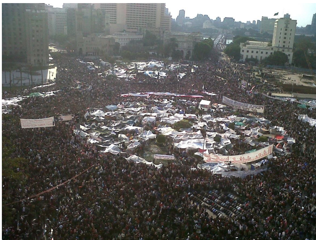
Ilustración 2: Movilización en la Plaza Tahrir, El Cairo, 8.2.2011

El tema de los toldos y de cómo se ha montado todo era, evidentemente, una referencia directa a la Plaza Tahrir. Y es algo que se ha conseguido porque antes de que saliera en los medios de comunicación españoles, que primero lo ignoraron –mejor dicho, una parte lo ignoró y otra parte desinformó adrede y tergiversó-, hubo un momento en el que el Washington Post sacó la foto [de la Puerta del Sol con los toldos] y entonces [los medios españoles] dijeron: “vamos a tener que empezar a hablar de ellos” 6 . Lo conseguimos y fue algo muy curioso: que tu periódico o tu radio, que tiene la redacción a 400 metros de Sol, pase por el Washington Post y vuelva. Pues se consiguió.