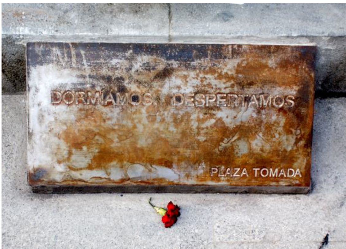
Ilustración 4: Dormíamos, Despertamos. Plaza Tomada