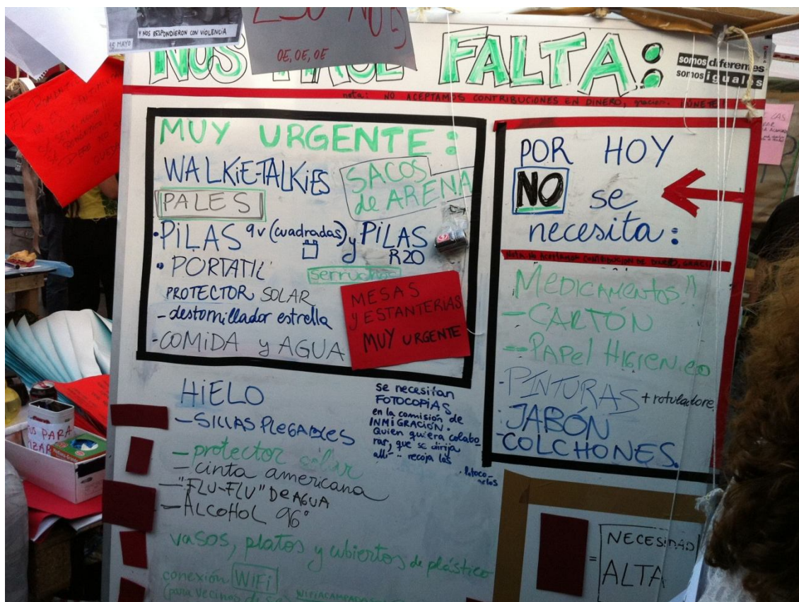
Ilustración 3: Nos hace falta / Por hoy no se necesita

muy analógico, un cartón colgado a una farola, pero en una hora había miles de personas que ya lo habían [leído] y en tiempo real.